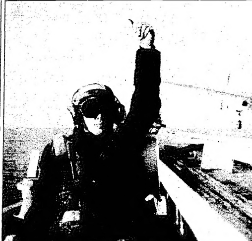
جلسة امريكي يعطي الخبير الخليل لالان غلانغ من قبل طلبة جامعة (واهايو) (واهايو) (واهايو)

لاي فريق السياسة الخارجية للرئيس بيل كلينتون مهمة صعبة في قلب امريكا يوم الاربعاء حينما حاول نصب اولبرايت كخليفة لوزير الخارجية الامريكي الذي استقال في وقت سابق من الشهر الجاري. وقد فشل اولبرايت في تسويق نفسه بين الطلاب الامريكيين في جامعة ولاية «واهايو» حيث فشل في اقناعهم بضرورة دعمه في الهجوم على العراق. وقد فشل اولبرايت في اقناعهم بضرورة دعمه في الهجوم على العراق. وقد فشل اولبرايت في اقناعهم بضرورة دعمه في الهجوم على العراق.